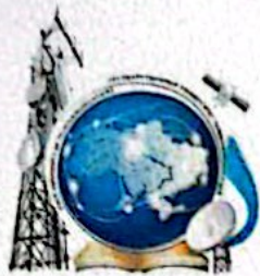
ДЕРЖАВНИЙ УНІВЕРСИТЕТ ТЕЛЕКОМУНІКАЦІЙ STATE UNIVERSITY OF TELECOMMUNICATIONS

Додаток/Supplement № 5072872 від/он 17.06.2017 (без диплома не діє/invalid/not valid without diploma)